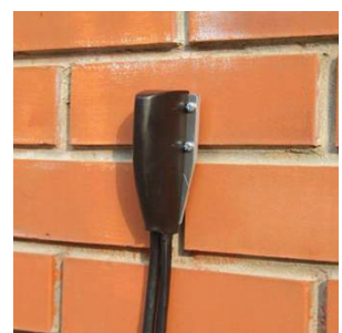
חיישן מותקן על קיר לבנים