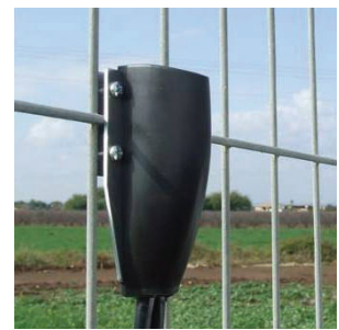
חיישן מותקן על גדר מרותכת