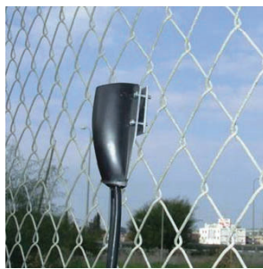
חיישן מותקן על גדר קלועה