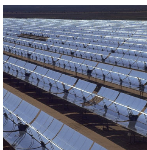
חיישן מותקן על גגות סלולאריים