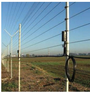
חיישן מותקן על גדר תיל מתוח

גידור אלקטרוני הינו גדר פיסית המשולבת מערך חיישנים. הגדר משמשת בדר"כ כמעגל אבטחה ראשון ביישובים, עסקים ובתים פרטיים. טכנולוגיה זו התפתחה מאוד במהלך השנים ומבוססת חיישנים מתוחכמים אשר שולחים אותות אלקטרוניים לבקר התראות המפענח את האותות ומגיב בהתאם על פי תכנות מראש. האותות מהבקר נשלחות למוקד מקומי או מרוחק ברמת הגלאי הבודד. למעגל זה ניתן לשלב מצלמות אבטחה המותקנות לאורך הגדר, עם או בלי שילוב אנליטיקה לזיהוי חדירה או ניסיון חדירה למתחם המוגן. מערכות אלו הוכיחו את עצמן כיעילות ביותר למניעת חדירה לאתרים ממוגנים.